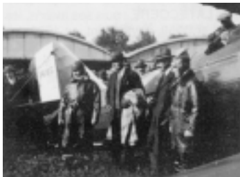
Coste - Lacoste - Breguet

En 1914, il est mobilisé en qualité de pilote. En 1916, 5500 exemplaires, en 17 versions du Bréguet 14, sont fabriqués. Il fonde la Compagnie des Messageries Aériennes en 1919. A partir de 1926, le BREGUET 19, construit à 1100 exemplaires, est un succès commercial international.