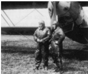
Coste et Bellonte

Le 4 septembre 1917, il est affecté au 1 er groupe d'aviation de Dijon. En avril 1922, il entre à la Compagnie des Messageries Aériennes comme navigateur puis il est chargé des équipements radio des avions de grands raids. De 1933 à 1939 il est ingénieur chez HISPANO-SUIZA.