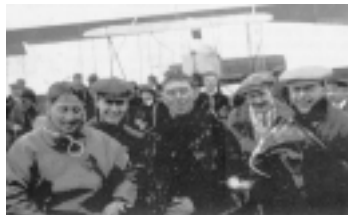
Renaux et Senouques

Il passe son brevet de pilote le 19 juillet 1910 (N° 139). En juillet 1911, après sa victoire dans le prix MICHELIN, il parcourt le circuit