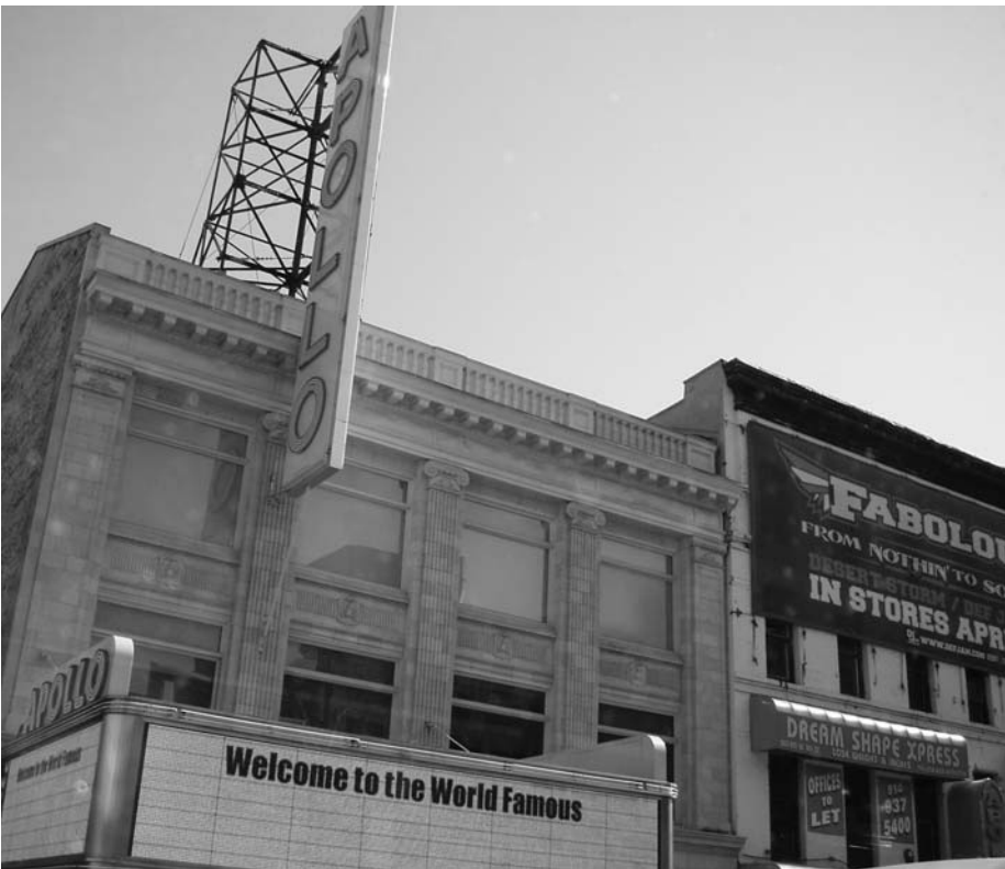
Le club Apollo en 2007