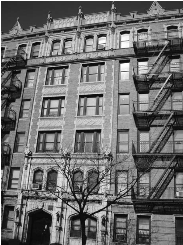
Immeuble d'Harlem où résida Duke Ellington - 2007