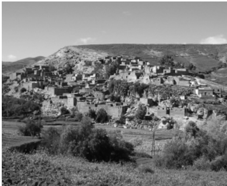
Un village dans l'Atlas (les montagnes marocaines)